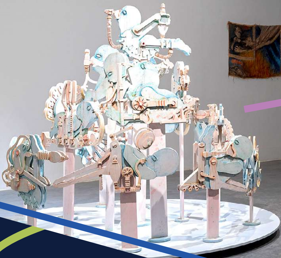
איה ברון | צילום: אלעד שריג / Still life