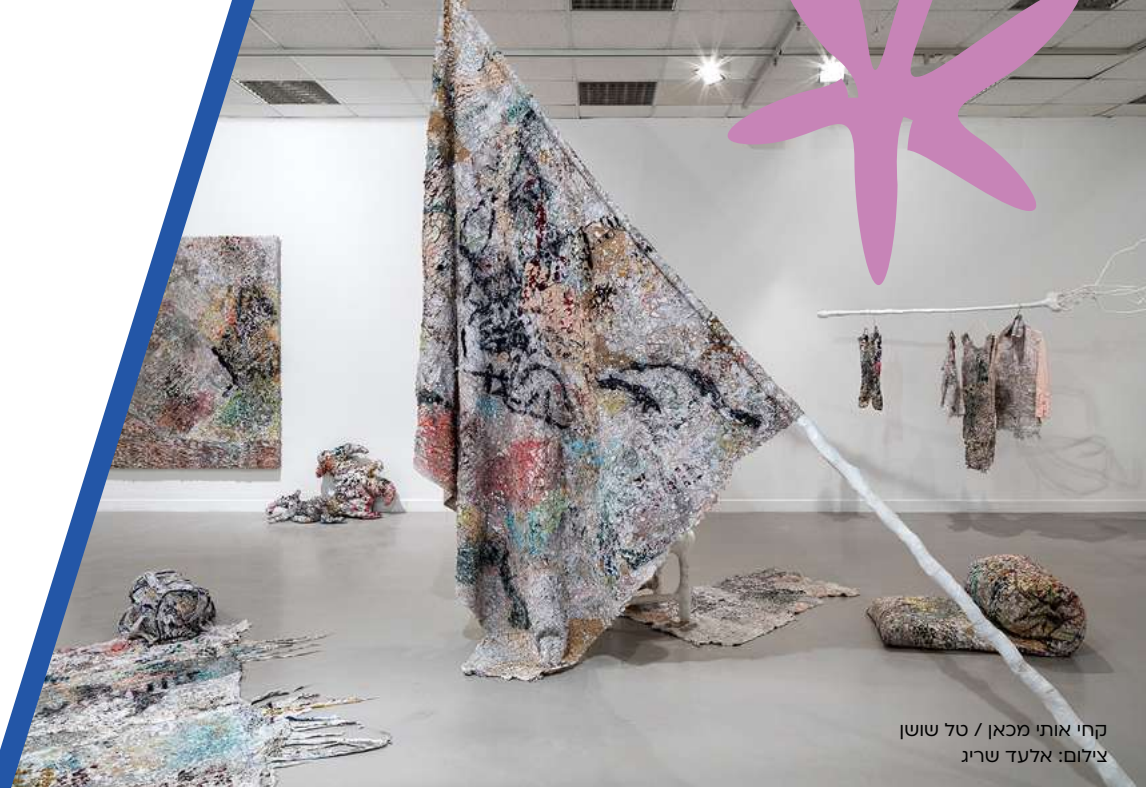
קחי אותי מכאן / טל שושן